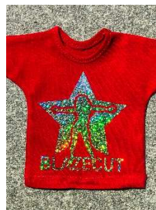
Trägerfolie abziehen, fertig!